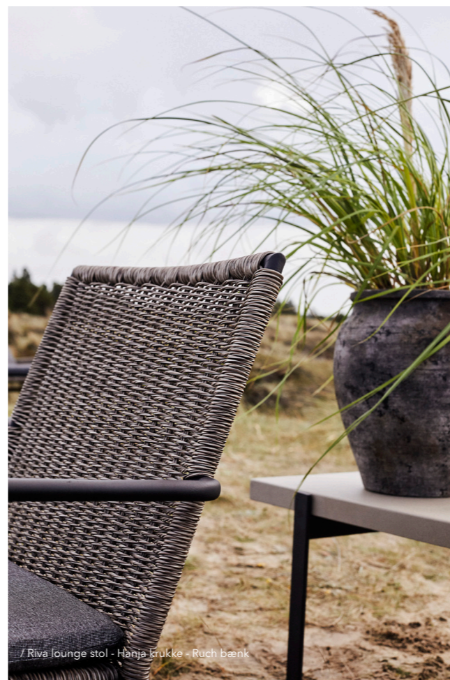
/ Riva lounge stol - Hanja krukke - Ruch bænk

Sæsonerne skifter, og vi retter blikket imod lysere og varmere vejr. Vores fokus skifter, og vi begynder at overveje uderummets indretning, der er med til at forlænge tiden vi tilbringer udenfor. Riva havemøbelkollektionen er en let og behagelig tilføjelse til udendørsoasen, der skaber en atmosfære, som emmer af moderne liv. Hanja krukkerne tilfører et strejf af rå taktilitet igennem den brændte og rustikke overflade.