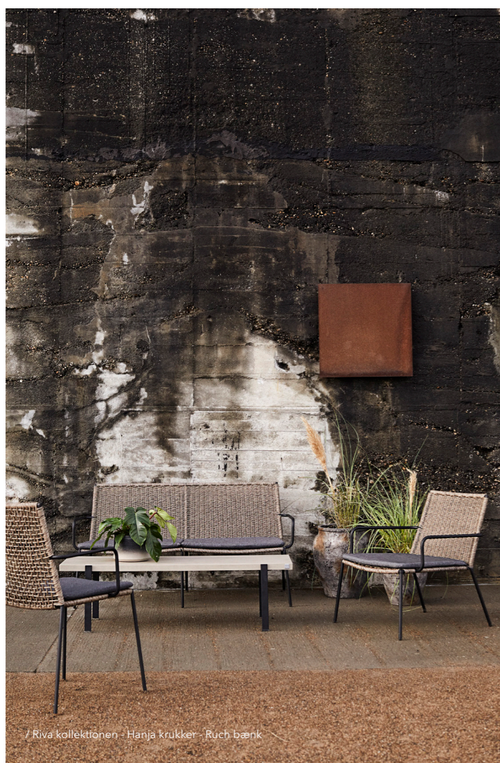
/ Riva kollektionen - Hanja krukker - Ruch bænk