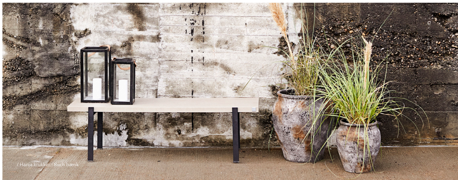
/ Hanja krukker - Ruch bænk