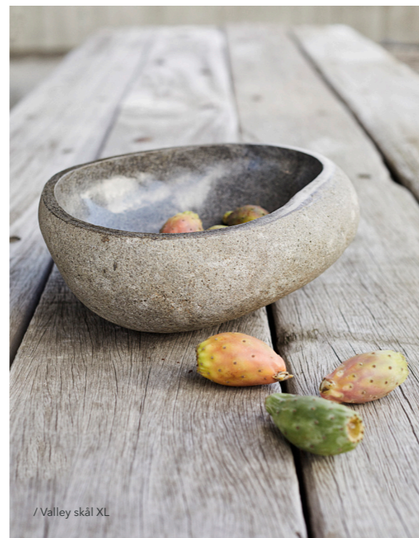
/ Valley skål XL