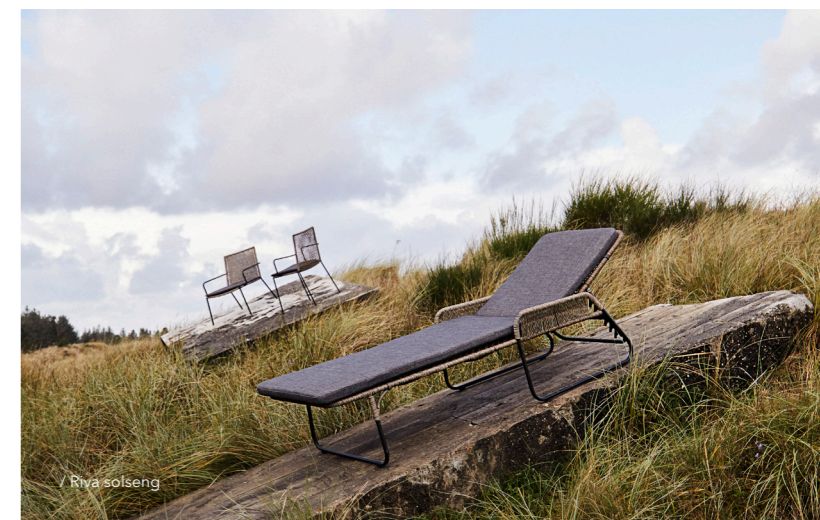
/ Riva solseng