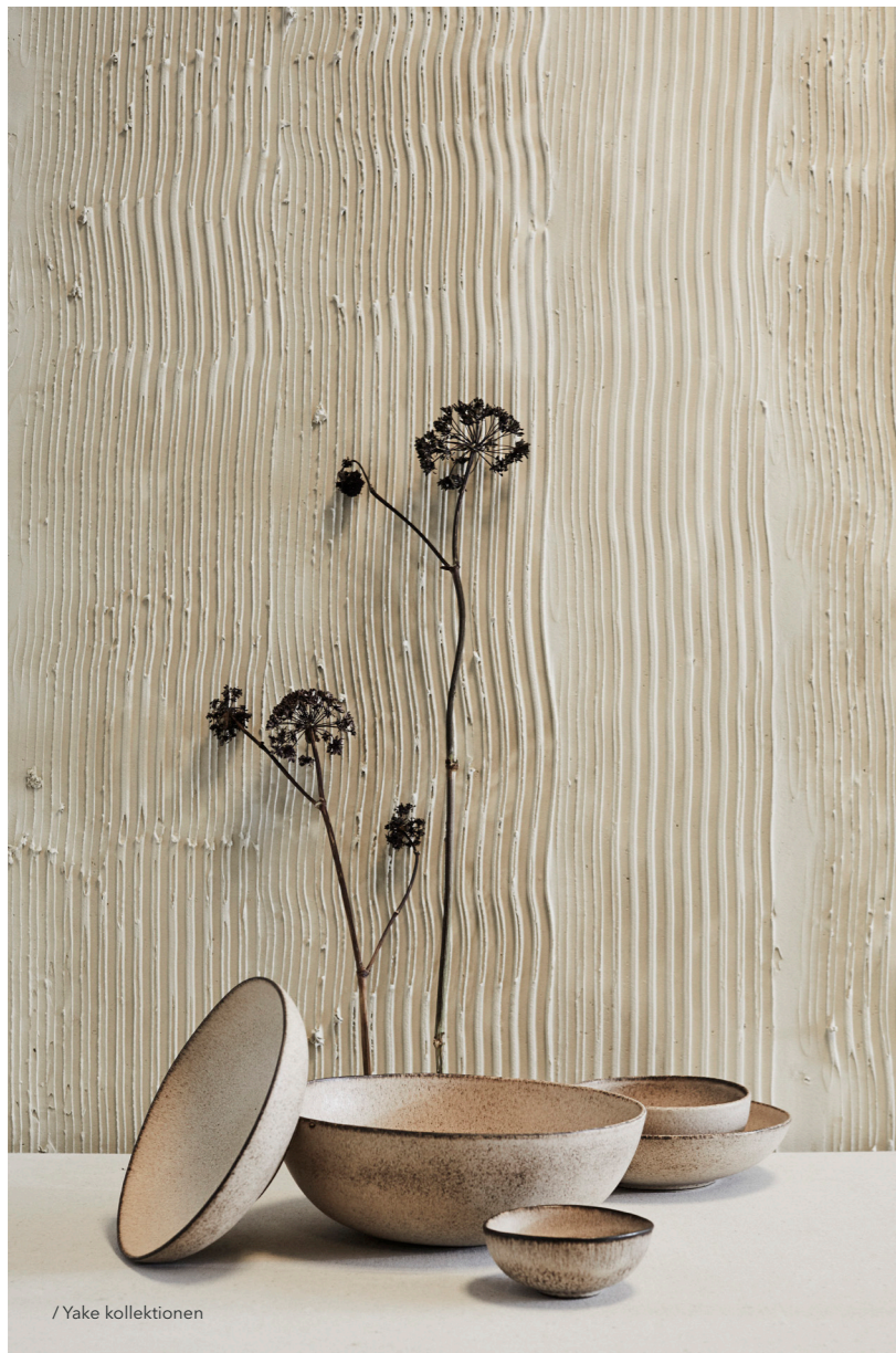
/ Yake kollektionen